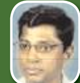
පොල්ගොල්ල ශාස්ත්‍රාචාර්යවරයා වෛද්‍ය විද්‍යාලයේ කම්බාවාර්ය, වෛද්‍ය මධුර පරණවිතාන

මෙ නිසා මෙවන් අගනා ඖෂධි හොඳින් හඳුනාගෙන ඒවා ව්‍යාප්ත කිරීමෙන් සංරක්ෂණය කිරීමත් තුළින් මෙවන් ඖෂධි ආරක්ෂා කරගත හැකි අතර, එය රෝග නිවාරණයට ද බෙහෙවින් වැදගත් වේ.