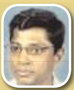
පොල්ගොල්ල ශාස්ත්‍රාර්ථවිද්‍ය වෛද්‍ය විද්‍යාලයේ කටිකාවාර්ය, වෛද්‍ය මධුර පරණවිතාන

මේ නිසා ඉතාමත් ගුණ දෙන අගනා ඔසුවක් වන වැල්මදුව නිසිලෙස රෝග සඳහා යොදා ගැනීමෙන් බොහෝ රෝග සමනය කරගත හැක.